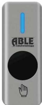
Стандартний (Світить синім)