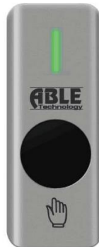
Активний (Світить зеленим)